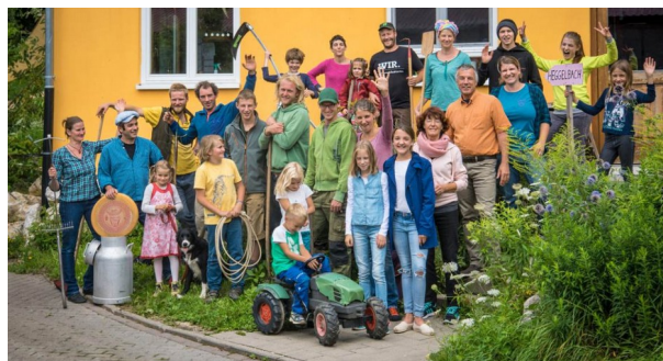
... ist die alte Generation 2018 im Kreis der (meist außerfamiliären) Nachfolger.

Das Modell setzt auf Seiten der Beteiligten ein gewisses Vertrauen in die langfristige Stabilität des Hofes voraus. Andererseits gibt es immer die Absicherung durch die