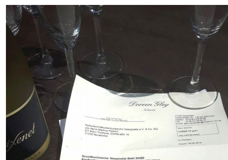
Schampus auf die Genehmigung!