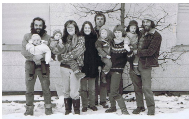
Hofgemeinschaft Heggelbach: Die junge Generation 1988...

Dieses System funktioniert nicht so gut auf großen Bio-Gemeinschaftshöfen. Das hat vorallem soziale Gründe. Eine Betriebsgemeinschaft, bei der sich mehrere Familien und Einzelpersonen zur gemeinsamen Bewirtschaftung zusammentun, ist nicht in gleicher Weise mit dem Hof „verheiratet“ wie eine traditionelle Bauernfamilie. Die Zusammenarbeit ist freiwillig und ein Ausstieg bei Meinungsverschiedenheiten möglich.